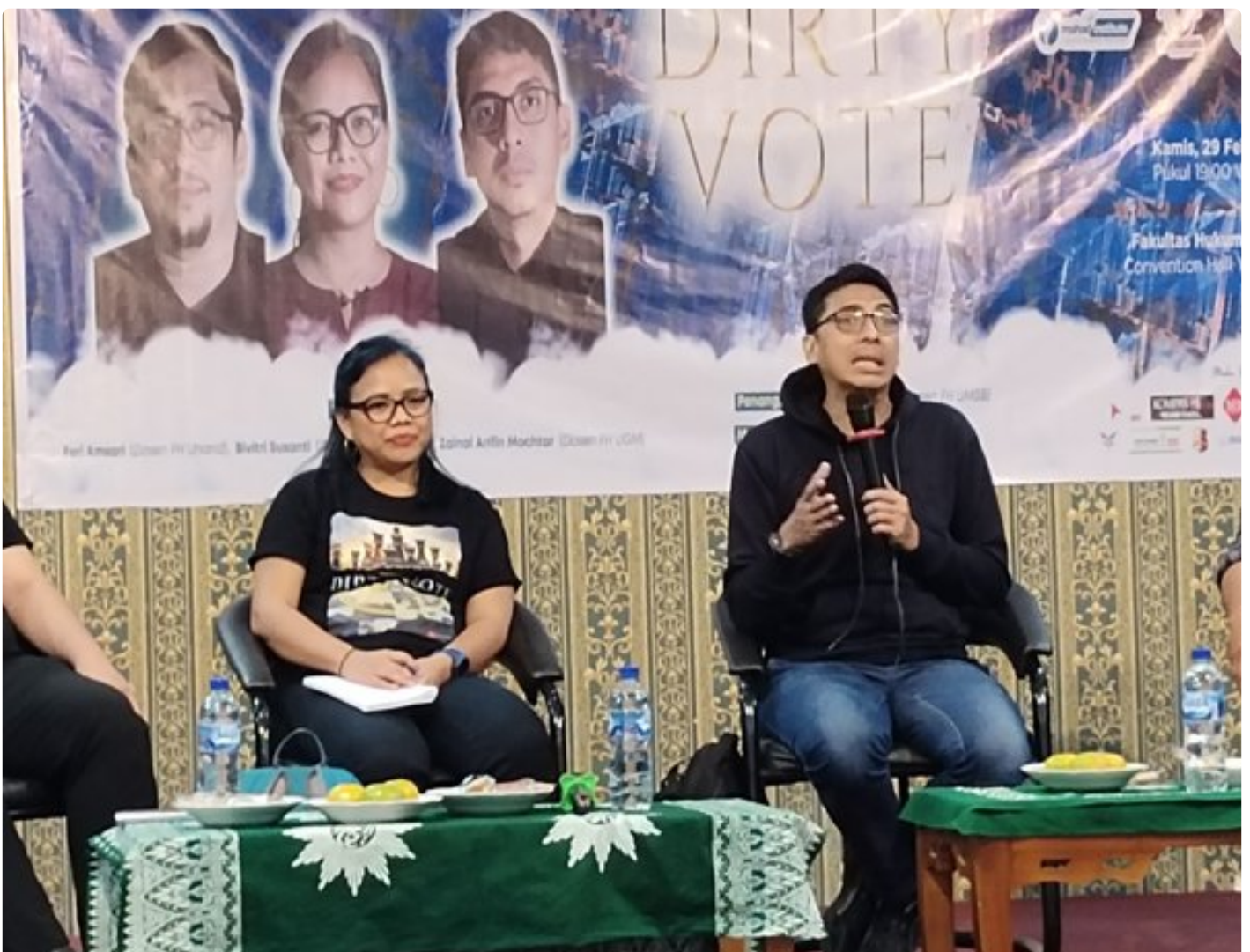
Pemeran Film Dirty Vote sebagai narasumber hadir di UMSB dalam acara diskusi dan tanya jawab tentang kesadaran berdemokrasi

Bukittinggi--Luhak FH Universitas Sumbar, LKDM FH UM Sumbar, dan Mahad Institute gelar diskusi untuk meningkatkan kesadaran demokrasi melalui